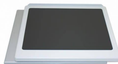
Plateau amovible en option