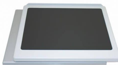
Plateau amovible en option