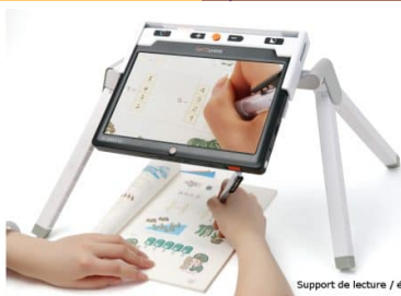
Support de lecture / écriture en option