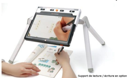
Support de lecture / écriture en option

Les tâches de précision nécessitant un fort grossissement deviennent plus aisées, améliorant ainsi votre capacité à travailler minutieusement.